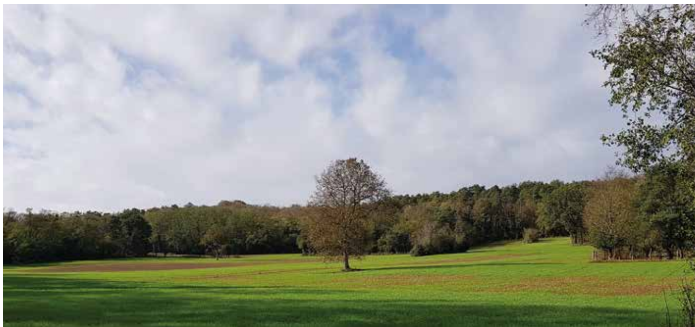
1- Chatillon vue vers le bois du Landy à l'ouest.

Certains projets sont examinés en commission départementale de la nature, des paysages et des sites, CDNPS, sous la présidence du Préfet de Seine-et-Marne (exemple photo 2 page 13 ).