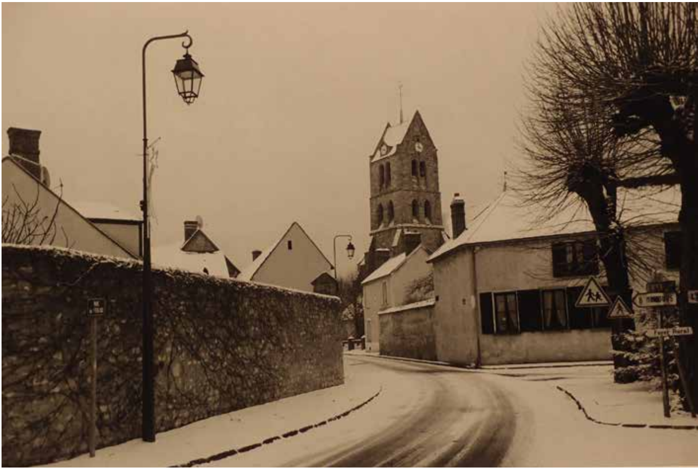
L'abbaye de Saint-Benoît-sur-Loire