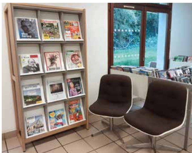
Coin lecture magazines.