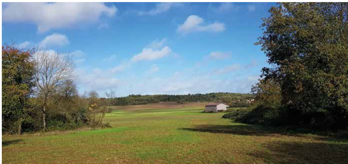
2- Depuis Chatillon, vue vers le nord, les Rochettes, les Fourneaux et le Crot au Fer.

L'idéal avant d'entreprendre des travaux est d'aller rencontrer l'architecte des bâtiments de France.