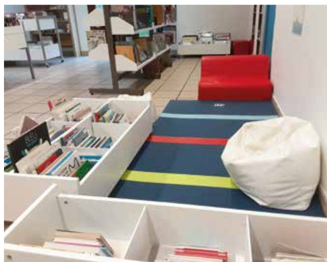
Coin lecture des tout-petits